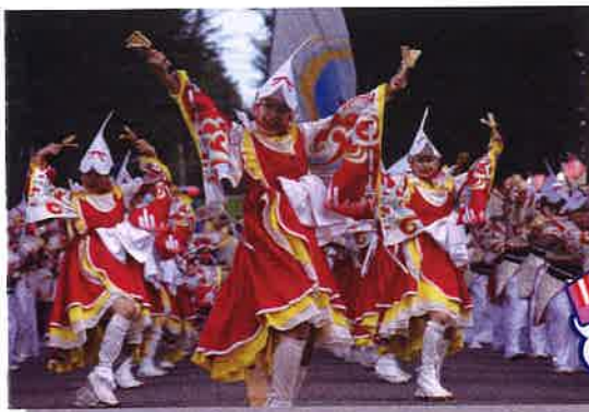
坂戸よさこい 主な停留所:坂戸市文化会館(さかと線)