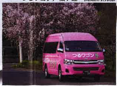
つるワゴン/松ヶ丘・関越病院線