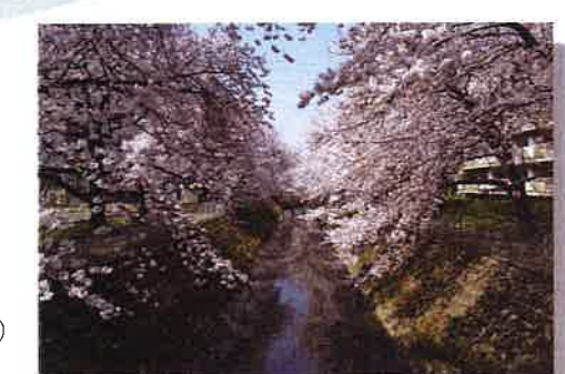
東坂戸団地の桜 見頃:3月下旬~4月上旬 停留所:東坂戸団地センター、東坂戸団地(みよしの線)