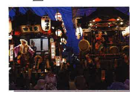
坂戸の夏祭り 日程:7月中旬 主な停留所:坂戸駅北口