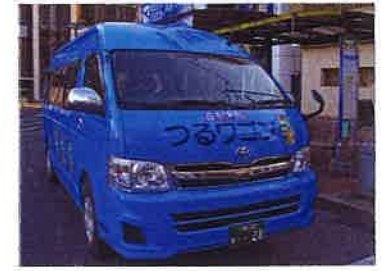
つるワゴン/東西線