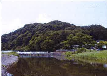
多和目城跡 停留所:城山学園(おおや線)