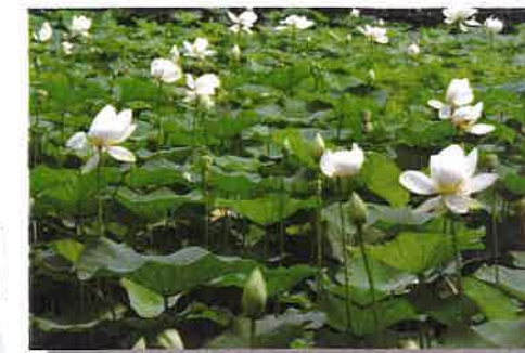
総合運動公園の蓮 見頃:6月中旬から9月 停留所:石井芝生美、運動公園(すぐろ線)