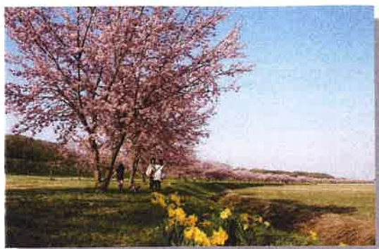
北浅羽の桜堤 見頃:3月中旬頃 停留所:今西、北浅羽(にっさい線)