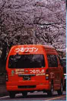
つるワゴン/上新田・若葉駅西口線

マイ時刻表 6 あなたが乗車する停留所から目的の停留所までの時刻表を作成します。お気軽にお問合せください。鶴ヶ島市都市計画課 049-271-1111 (代表)